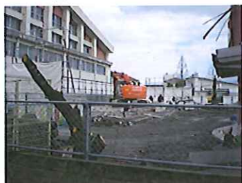
北園舎が なくなりました。

さらに、1月中旬頃より第一体育館横(園バス待機場)付近が通行できなくなります。歩行での通行もできません。旭学園通り東側駐車場や第二体育館下駐車場を利用される場合は、駐車場より徒歩で市営バスの駐機場を通り短大前を通り、仮園舎まで送迎していただくこととなります。長い期間ではないとは思いますが、どうぞ御理解と御協力をよろしくお願いいたします。その都度、メールでお知らせしますのでよろしくお願いいたします。