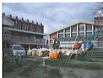
2階ホールも 解体が始まりました。